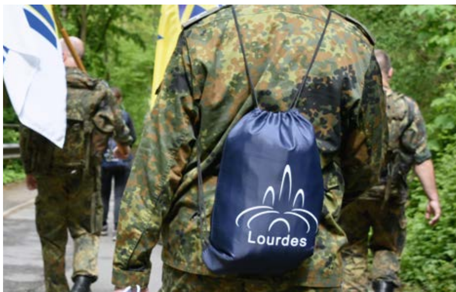
Etwa 80 Bundeswehrsoldaten aus Koblenz pilgerten zum Marienberg nach Vallendar.