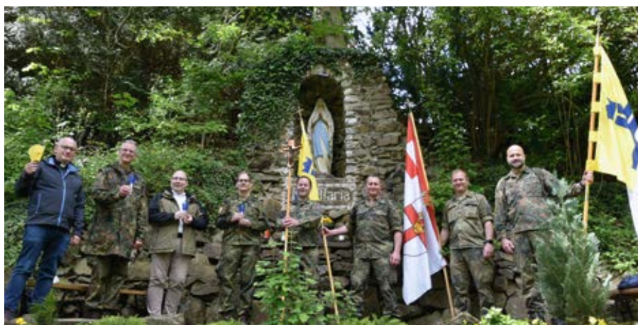
Ihr Ziel war nach einer Lichterprozession die Lourdes-Grotte.